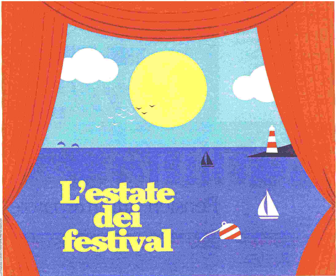
ILLUSTRAZIONE DI MARIA CHIARA BIANCHINI PER IMMAGISTER

Sarà una stagione ricca di eventi in Italia. La cultura innanzitutto. Con "Le nuove vie" di Courmayeur , le tribune per i libri nelle piazze di Cortina, Pordenone e Mantova . Lo spazio per la Mente di Sarzana , la Comunicazione protagonista a Camogli . Una lunga maratona per una lunga estate. E poi gli spettacoli Da Bolzano a Trento , da Verona a Treviso , da Pesaro a Volterra : concerti, jazz session, rassegne cinematografiche, happening di diversi generi musicali, opera lirica, teatro di prosa, danza classica e moderna. E, infine, è d'obbligo fare un salto in Europa per scoprire le manifestazioni più importanti: Edimburgo, Salisburgo, Bayreuth, Locarno, Arles e Leeds